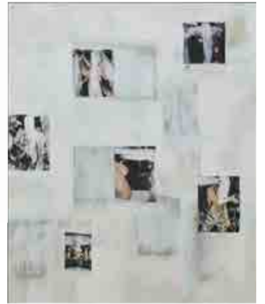
Rodney Graham: »Maiden's Pile-Driving Return« 2017 | Acryl Gesso, Sprühfarbe und Papier auf Leinwand, 149.8 x 124.4 cm | © Rodney Graham

Den Auftakt zum Jubiläumsjahr anlässlich des 50-jährigen Bestehens der Galerie Schöttle bildet eine Einzelausstellung mit Arbeiten von Rodney Graham. Visuell ein besonnener Auftakt, konzeptuell ein Statement zu einem Galerieprogramm, das 50 Jahre Kunstgeschichte begleitet, gefördert und weitergeschrieben hat. 1968 in der Prinzregentenstraße gegründet, nach Jahren in der Martiusstraße und seit 2002 in dem neu gebauten White Cube in der Amalienstraße ansässig, steht die Galerie für eine konzeptuell ausgerichtete, medienübergreifende Kunst mit globaler Reichweite. Rüdiger Schöttle zählt zu den wenigen Münchner Galeristen von internationalem Rang. Künstler wie Dan Graham, Lawrence Weiner, On Kawara und Jeff Wall wurden von ihm in München eingeführt oder näher bekannt gemacht, nie immer nur in rein